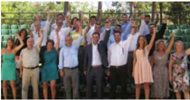
Κι αν παρήλθον οι χρόνοι εκείνοι, των ερώτων χρυσή εποχή...