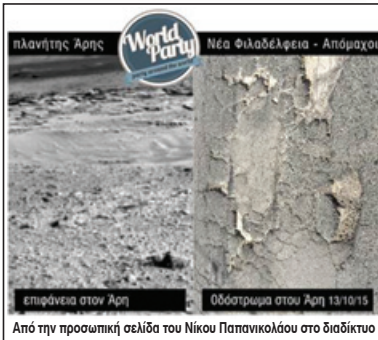
Από την προσωπική σελίδα του Νίκου Παπανικολάου στο διαδίκτυο τέλος... Αυτό το ξέρουμε, αναρωτιέμαι όμως για κάτι, βρε παιδιά... Μήπως, μ' αυτά που κάνει, δίνει άλλοθι σε κάποιους, που βολεύεται μ' αυτή την κατάσταση; Απορία ψάλτου βηξ...